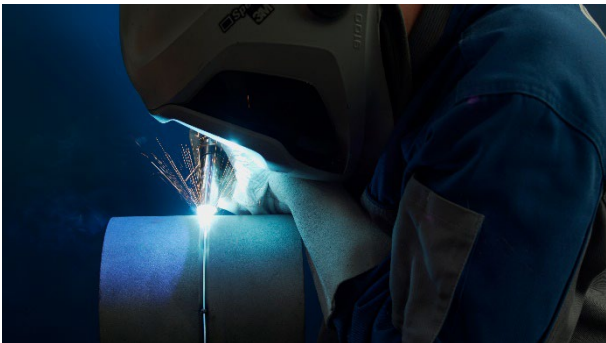
Bild 2: Der Schweißer profitiert von der einfachen Handhabung auch bei anspruchsvollen Bedingungen.