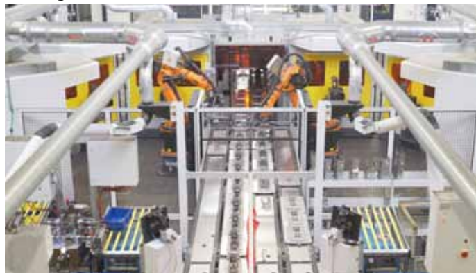
Bild 1: In der neuen Roboteranlage arbeiten Handlingsystem und Schweißtechnik Hand in Hand zusammen.

Deshalb hat BPW Anfang des Jahres eine ältere CLOOS-Anlage aus 2002 zum Schweißen von Stützen durch eine neue Hightech-Roboteranlage ersetzt. Die neue Schweißanlage besteht aus mehreren Teilbereichen, die sich optimal ergänzen.