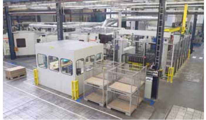
Bild 5: Die Absaugung der Anlage erfolgt über ein komplett geschlossenes System.

Durch die optimierte Be- und die automatisierte Entladung konnte BPW die Rüst- und Nebenzeiten stark verringern. Daneben wurden die Durchlaufzeiten in der Anlage stark verkürzt. „In der alten Anlage hatten wir zwölf Lichtbögen,“ erklärt Andreas Schatner, Meister im Bereich Bremsbacken- und Stützenfertigung. „Heute schaffen wir mit sechs Lichtbögen den gleichen Output.“