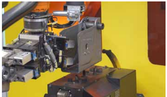
Bild 2: Die Handlingroboter bestücken und entladen die Schweißzellen vollautomatisch.

zen wieder und legt sie auf ein weiteres Förderband, welches die Bauteile in den nächsten Anlagenbereich bringt. Die Handlingroboter sind jeweils mit einem Doppelgreifer ausgestattet, sodass die Abholung und die Ablieferung der Bauteile fast gleichzeitig erfolgen. Die Roboter können beide Seiten der Fördertechnik entladen.