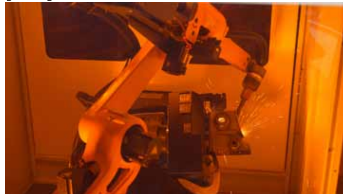
Bild 3: Jede Schweißzelle ist mit einem QIROX QRH-280 sowie einem 2-Stationen-Werkstückpositionierer ausgestattet.

Alle Schweißzellen sind gleich aufgebaut und verfügen jeweils über einen 2-Stationen-Werkstückpositionierer mit horizontalem Wechsel sowie Dreh- und Schwenkbewegung. Jede Zelle ist mit dem kompakten Schweißroboter QIROX QRH-280 ausgestattet, der besonders schnell und hochdynamisch agiert. Aufgrund seiner geringen Masse und kleinen Hebelarme erreicht der Roboter große Geschwindigkeiten und gleichzeitig eine höhere Positioniergenauigkeit.