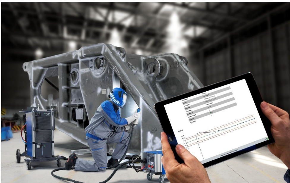
Bild 3: Auch in der manuellen Schweißtechnik gewinnen Vernetzung und Digitalisierung zunehmen an Bedeutung.