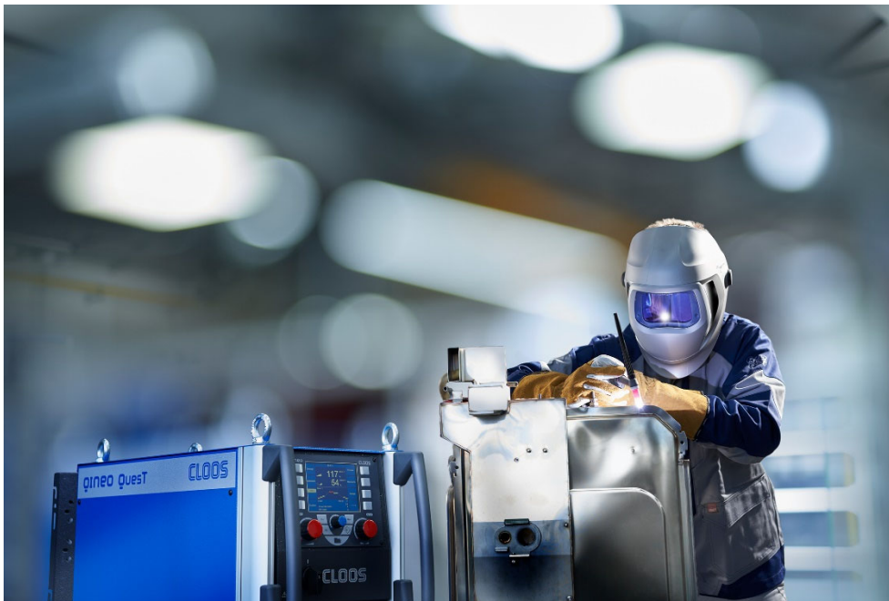
Bild 2: Die neue Hightech-Schweißstromquelle QINEO QuesT löst hochanspruchsvolle WIG-Aufgaben zuverlässig und effizient.